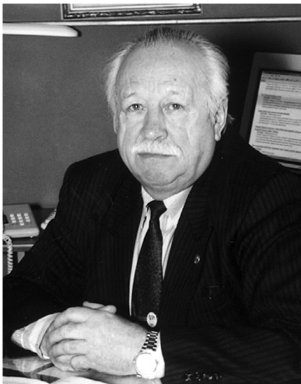
Рис. 1. А.Ф. Алимов (1933–2019 гг.). Fig. 1. A.F. Alimov (1933–2019).