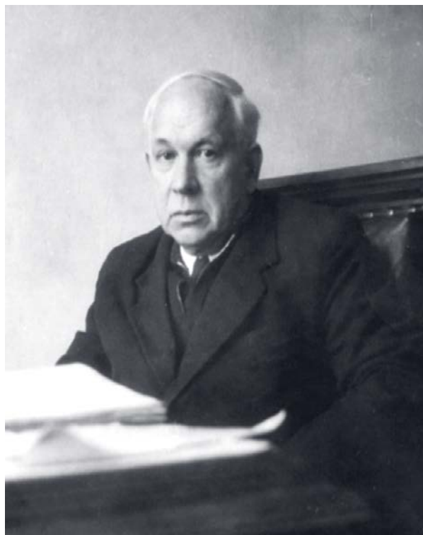
Рис. 2. В.И. Жадин (1896–1974 гг.). Fig. 2. V.I. Zhadin (1896–1974).

тать в области продукционной гидробиологии. Последовали экспедиции на Беломорскую биологическую станцию (ББС) ЗИН на озера Кривое и Круглое, в Дальние Зеленцы на озера Зеленецкое и Акулькино, а затем на реки и озера Ленинградской и Калининградской областей, Бурятии, Дальнего Востока и Средней Азии. При этом он продолжал заниматься экологией двустворчатых моллюсков и по результатам этих исследований опубликовал ряд статей в академических журналах и коллективных монографиях (Алимов [Alimov] 1970, 1972, 1974, 1975), и в 1979 г. защитил докторскую диссертацию на тему «Функциональная экология пресноводных двустворчатых моллюсков», а через два года опубликовал монографию под тем же названием (Алимов [Alimov] 1981).